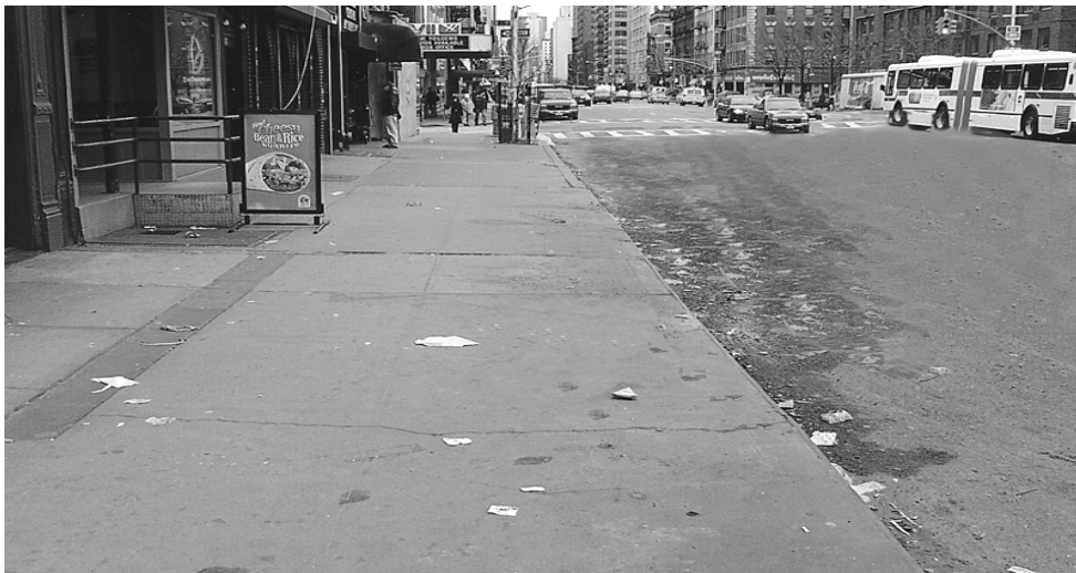
骯髒的行人道(請見 " 行人道與行馬路邊緣 " )