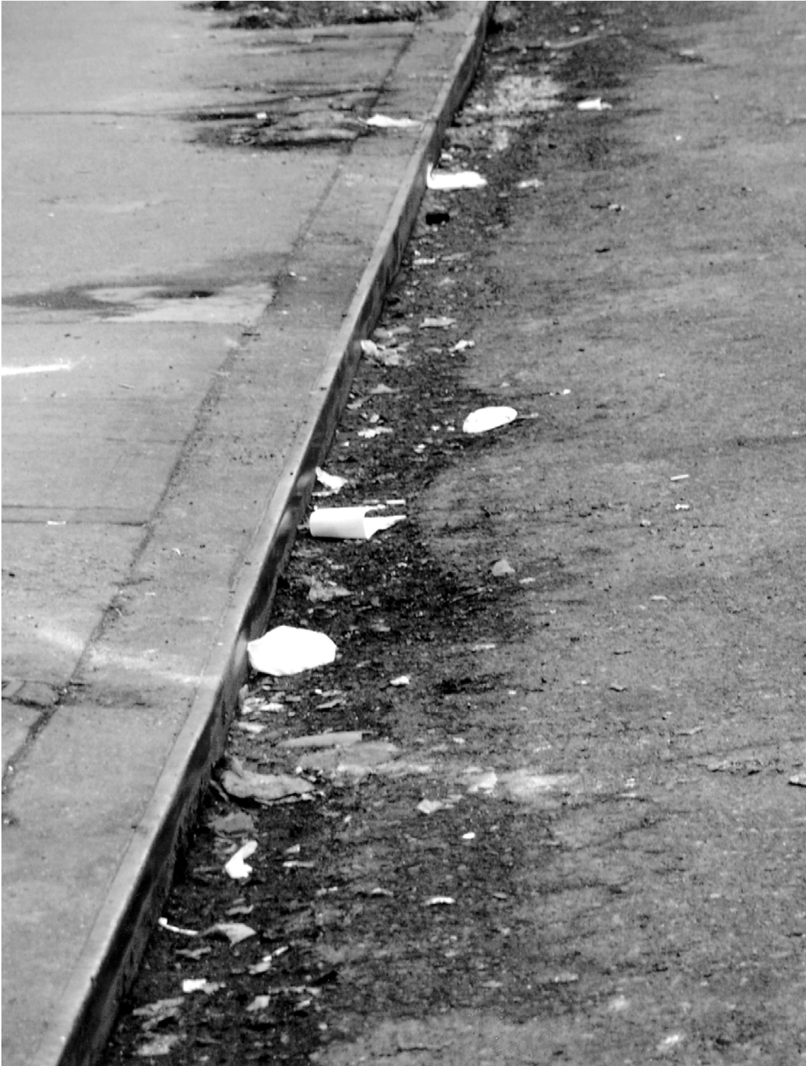
沒有打掃行人道邊緣至街道 18 寸內範圍（見“行人道與馬路邊緣”）