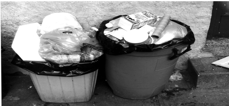
沒有覆蓋的垃圾桶(見 " 垃圾桶 " , " 覆上蓋的 " 和 " 妥當的 " )