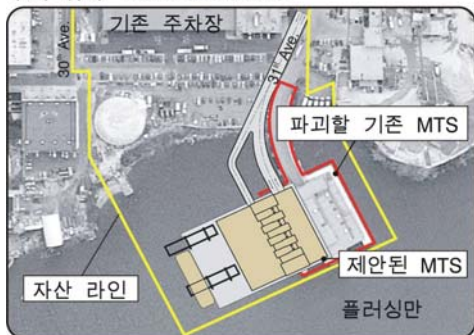
부지 위치 North Shore MTS