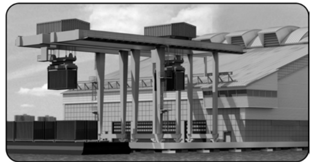
부지 쪽 모습 (Land Side View)